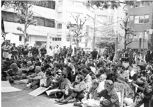
全都500名の大結集でメーデー集会を開催（柏木公園）

七回目となる全都野宿労働者統一メーデー。新宿の仲間の大部隊を筆頭に、池袋、渋谷、山谷、そして、今年初参加の三多摩（立川）から、総勢五百名の野宿者、日雇労働者、