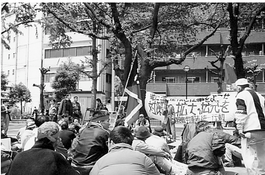
池袋中公園で集会、司会も基調定期も野宿の仲間が全部やりきる。