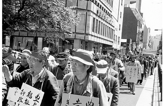
豊島区役所前では「当り前の福祉を出せ！」とシュプレヒコール