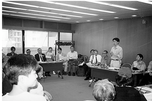
5月19日「もやい互助会設立集会」が50名の参加で開かれる。